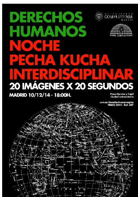
Fig. 1. Cartel anunciador del evento, obra del diseñador gráfico e ilustrador Jaime Gracia [5]

El Proyecto culminó en un evento público que tuvo lugar el miércoles 10 de diciembre de 2014 al que pudo asistir toda la comunidad universitaria complutense y el público general que lo deseó que llevó por título “Noche PechaKucha interdisciplinar sobre Derechos Humanos” (Fig. 1). Se eligió precisamente esa fecha por su carga simbólica, pues la Asamblea General de Naciones Unidas declaró en 1950 el 10 de diciembre como Día de los Derechos Humanos, para hacer llegar a las gentes del mundo la Declaración Universal de Derechos Humanos como ideal común para todos los pueblos y naciones.