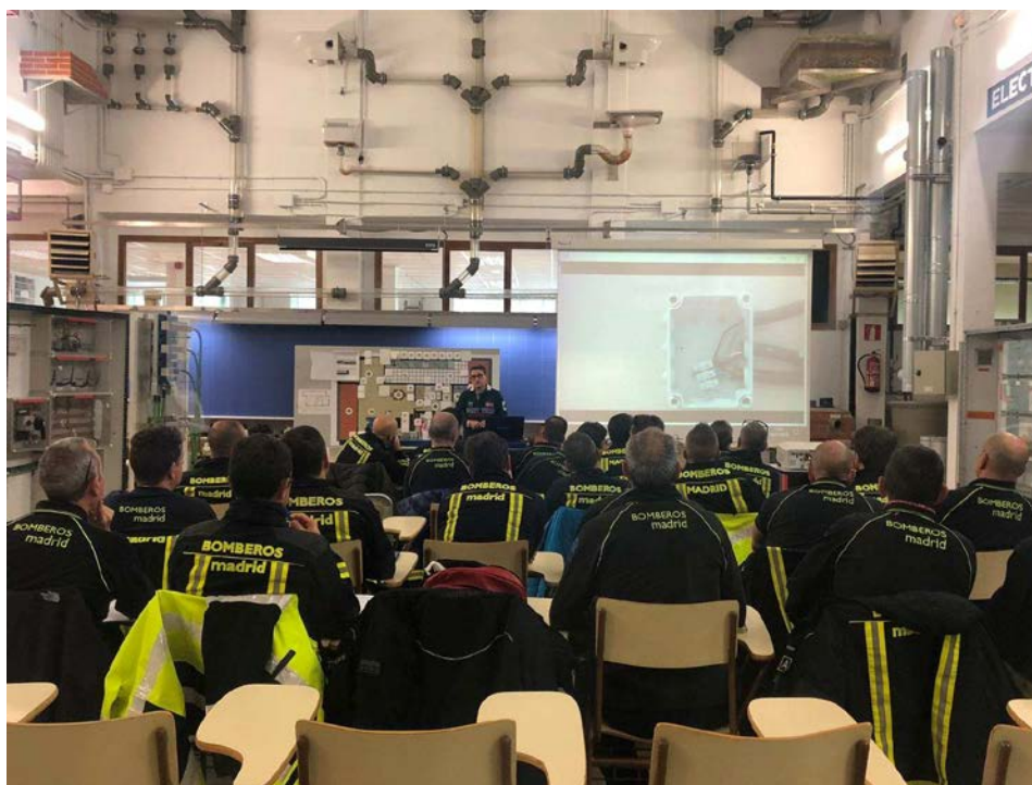
Fig. Curso Bomberos del Ayuntamiento de Madrid

La apuesta del Aula Taller para servir de puente entre la formación académica y la actuación profesional del Arquitecto Técnico se materializa en la organización de jornadas técnicas con firmas comerciales del sector, como complemento a la docencia y en el ánimo de establecer una relación directa entre contenidos docentes y ámbito comercial.