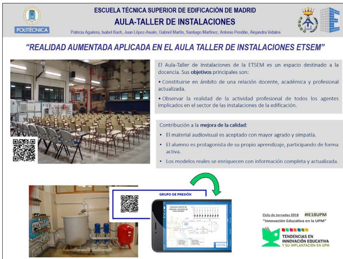
Fig. Póster presentado en las JORNADAS ie18UPM

El Aula Taller participó en las Jornadas del Programa 4º de ESO + EMPRESA realizadas en la ETSEM, celebradas del 8 al 12 de abril de 2018. Dichas jornadas son coordinadas por el Vicerrectorado de Alumnos y EU dentro del Proyecto de Promoción de Vocaciones Tecnológicas. En la labor de orientar a los alumnos, se realizó una visita guiada por los simuladores adaptada a su nivel académico y una propuesta de trabajo en base a la realización de contenidos gamificados con el servicio web de educación social Kahoot.