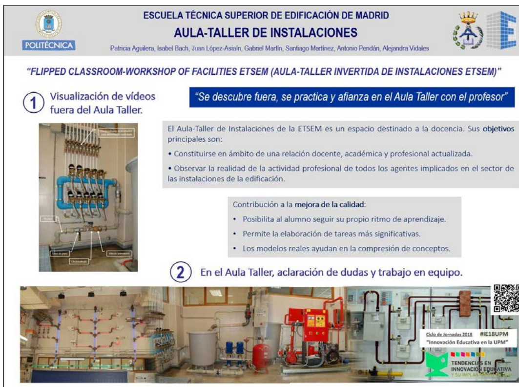
Fig. Póster presentado en las JORNADAS ie18UPM

Estos proyectos han permitido iniciar la realización de diversos vídeos educativos, así como la señalización de simuladores y maquetas con realidad aumentada en forma de códigos QR.